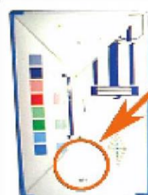
Krabica bez loga

Pokiaľ je krabica označená logom výrobcu, ktorý sa ale nenachádza v zozname, uveďte ju ako „ Ostatné označené obaly “.