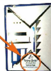
Krabica s logom